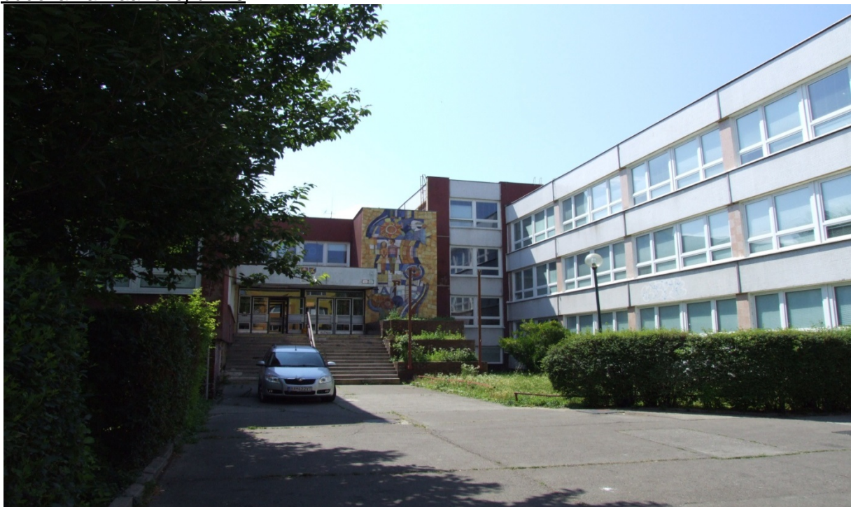
budova na Haanovej ul. 28